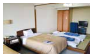
全室独立洗面台を完備