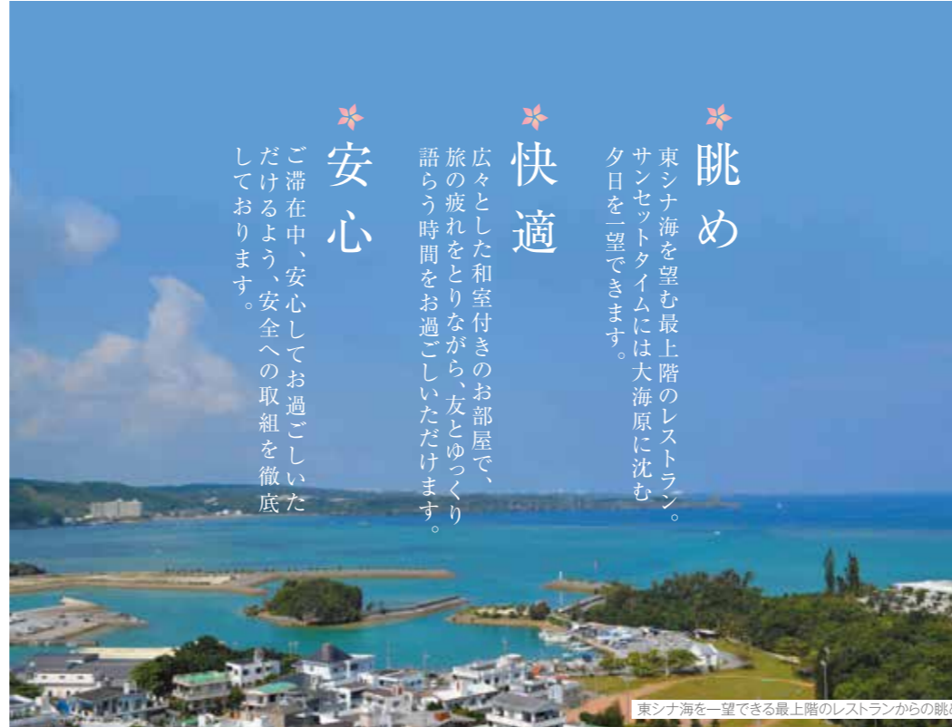
東シナ海を一望できる最上階のレストランからの眺め

東シナ海を望む最上階のレストラン。サンセットタイムには大海原に沈む夕日を一望できます。 広々とした和室付きのお部屋で、旅の疲れをとりながら、友とゆっくり語らう時間をお過ごしいただけます。 ご滞在中、安心して過ごしていただけるよう、安全への取組を徹底しております。